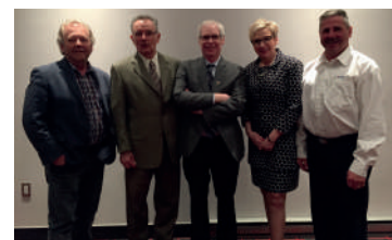
La MRC était partenaire, avec la Chambre de commerce de Val-d'Or, d'une conférence sur le Mentorat, en mars 2016.

Dans le but de développer le savoir-être professionnel d'un entrepreneur, le mentorat peut se définir comme une aide personnelle et volontaire à caractère confidentiel. Apportée par une personne d'expérience dans le monde des affaires, cette aide sert à répondre aux besoins particuliers d'un entrepreneur.